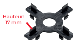
Epaisseur: 2, 3 et 4,5mm